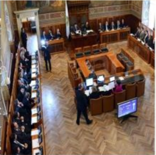
O Grande Concílio de San Marino