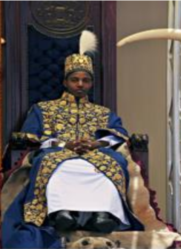
Chefe Oro do Reino (chefatura) do Toro