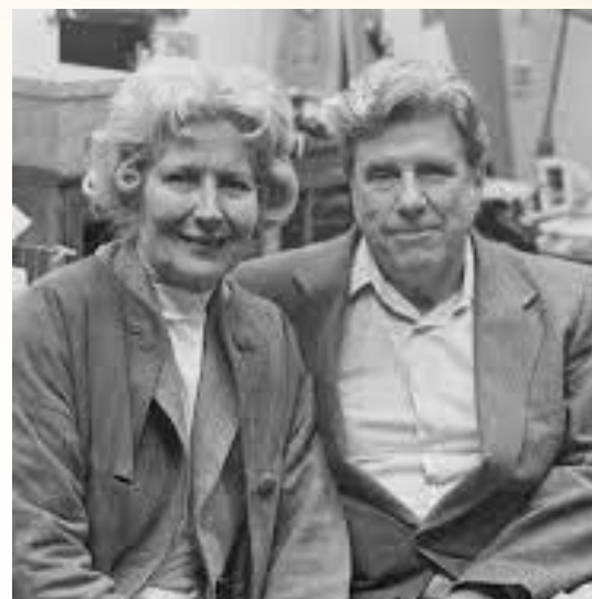
Education and Anthropology (1955)