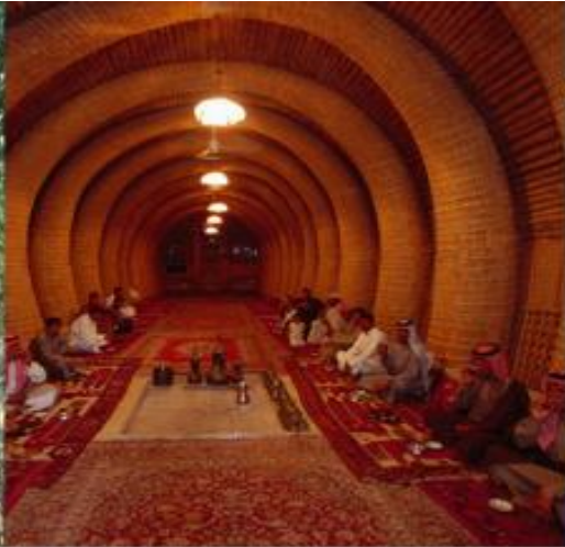
Tribo dos árabes do pântano iraquiano